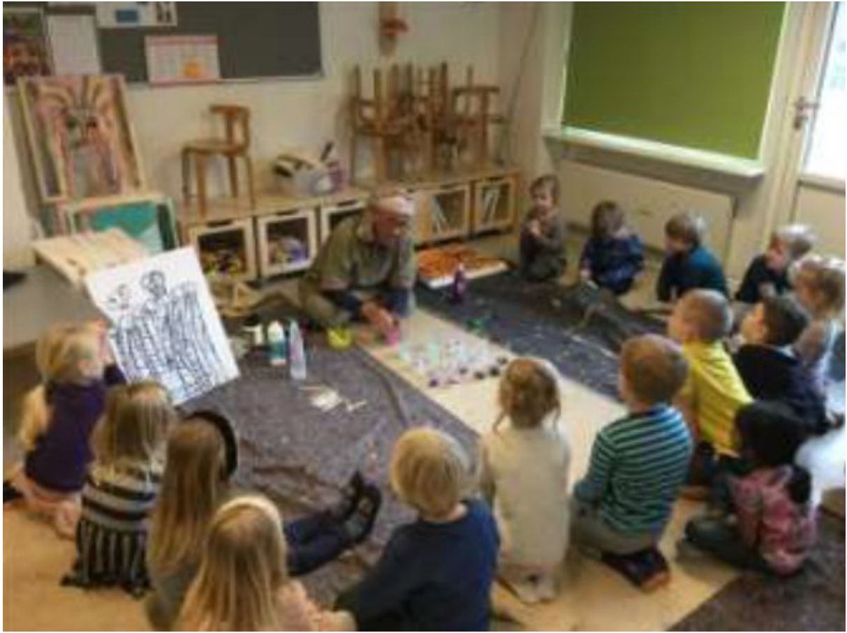
Den årlige kunst uge i børnehaven med ekstern kunstner.